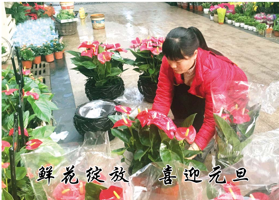
鲜花绽放 喜迎元旦

“这不马上快过节了，想买点鲜花，为家里增添一点色彩，也增加一点喜庆的气氛。”12月28日，在鲁南花卉市场，一位顾客一边挑选鲜花一边笑着说。